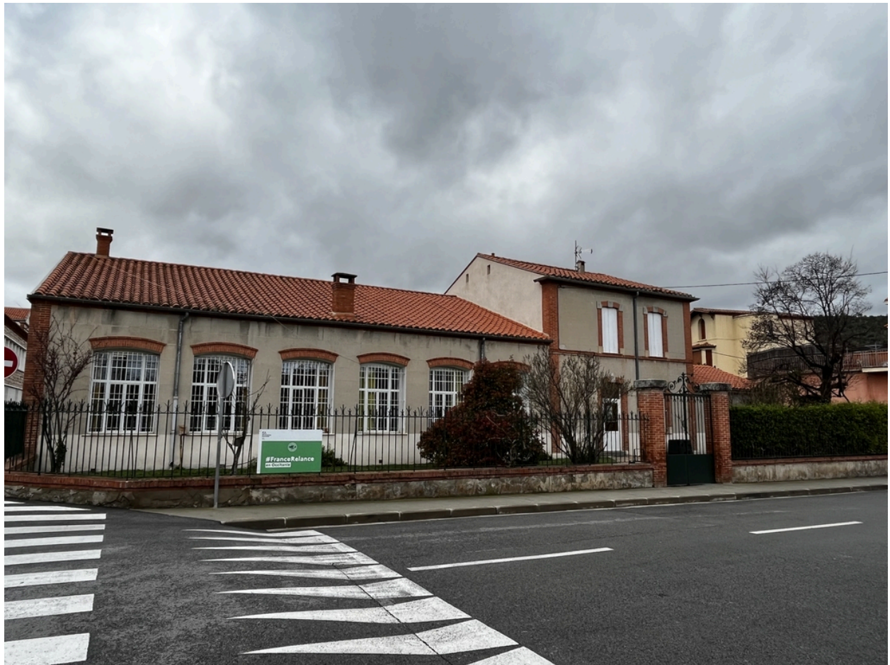
École maternelle, Écoles primaires de filles et de garçons, actuelles école maternelle Pasteur, écoles élémentaires Jean Petit et Jean Clerc - Façade Est du bâtiment principal de la maternelle.