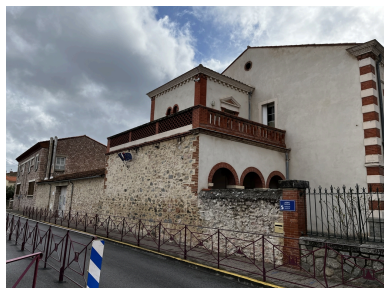
École maternelle, Écoles primaires de filles et de garçons, actuelles école maternelle Pasteur, écoles élémentaires Jean Petit et Jean Clerc - Pavillon Nord de l'école primaire de garçons.