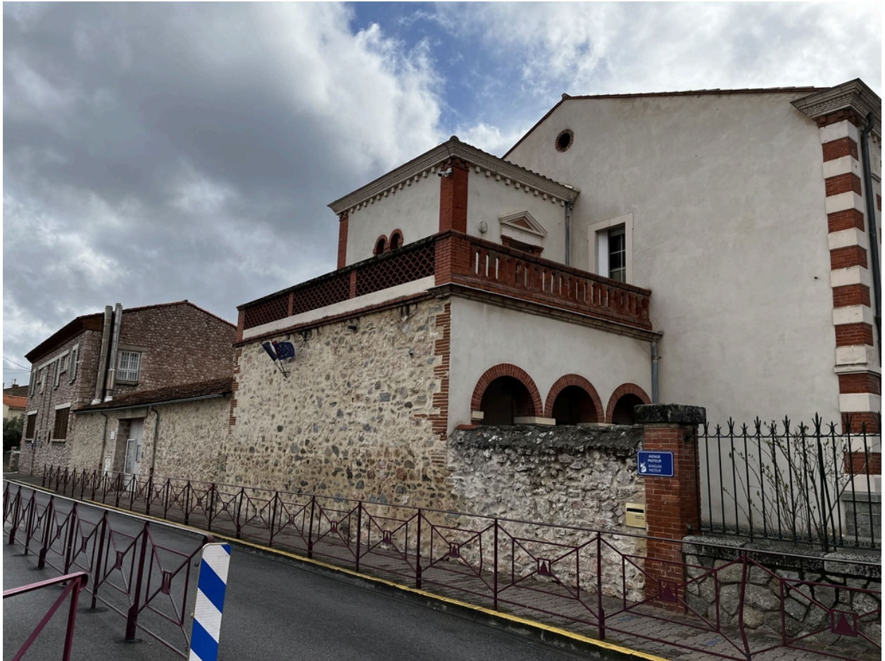
École maternelle, Écoles primaires de filles et de garçons, actuelles école maternelle Pasteur, écoles élémentaires Jean Petit et Jean Clerc - Pavillon Nord de l'école primaire de garçons.