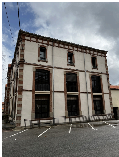
École supérieure des filles, puis Collège Moderne de Garçons dit « Pasteur » - Façade Ouest du corps de bâtiment principal. IVR76_20226665793NUCA