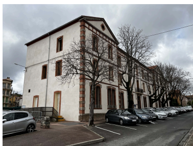
École supérieure des filles, puis Collège Moderne de Garçons dit « Pasteur » - Vue générale Nord-Est du bâtiment principal.