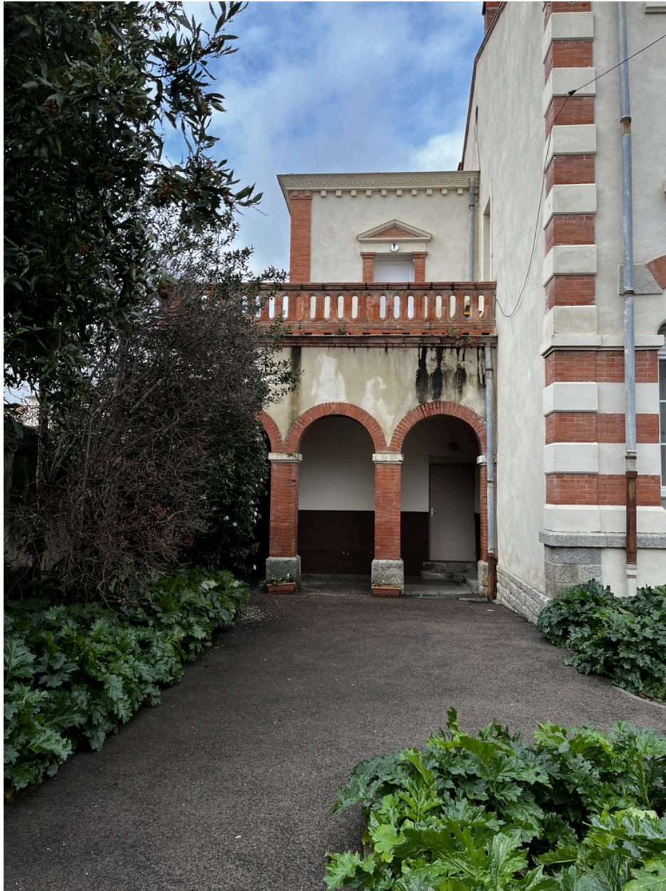
École maternelle, Écoles primaires de filles et de garçons, actuelles école maternelle Pasteur, écoles élémentaires Jean Petit et Jean Clerc - Pavillon Sud de l'école primaire de filles.