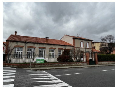
École maternelle, Écoles primaires de filles et de garçons, actuelles école maternelle Pasteur, écoles élémentaires Jean Petit et Jean Clerc - Façade Est du bâtiment principal de la maternelle.