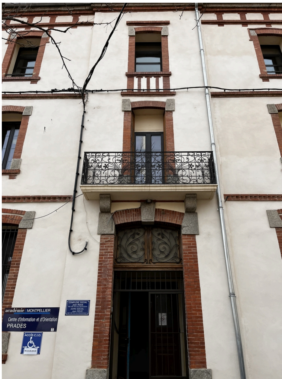
École supérieure des filles, puis Collège Moderne de Garçons dit « Pasteur » - Travée axiale en façade Nord du bâtiment principal.