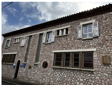
École maternelle, Écoles primaires de filles et de garçons, actuelles école maternelle Pasteur, écoles élémentaires Jean Petit et Jean Clerc - Façade Nord du corps de bâtiment à maçonnerie en marbre rose de l'école élémentaire Jean Clerc.