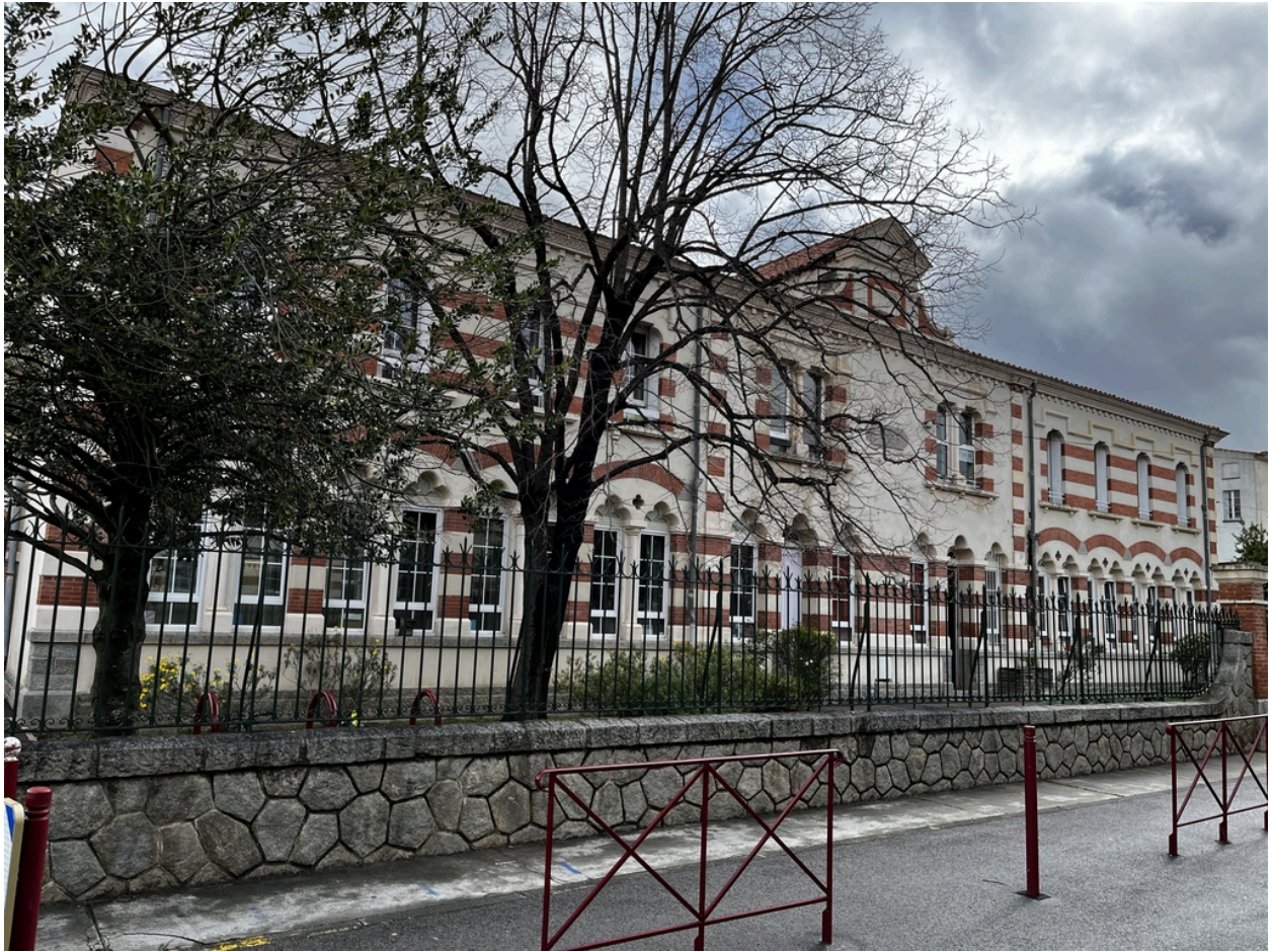
École maternelle, Écoles primaires de filles et de garçons, actuelles école maternelle Pasteur, écoles élémentaires Jean Petit et Jean Clerc - Façade principale de l'école primaire de filles.