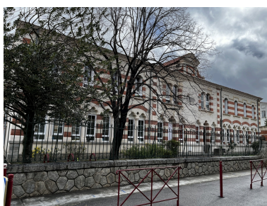
École maternelle, Écoles primaires de filles et de garçons, actuelles école maternelle Pasteur, écoles élémentaires Jean Petit et Jean Clerc - Façade principale de l'école primaire de filles.