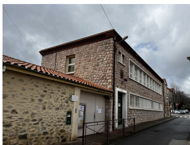
École maternelle, Écoles primaires de filles et de garçons, actuelles école maternelle Pasteur, écoles élémentaires Jean Petit et Jean Clerc - Corps de bâtiment à maçonnerie en marbre rose de l'actuelle école élémentaire Jean Petit.