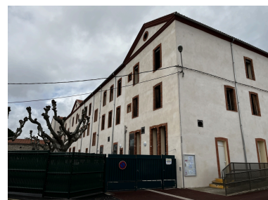
École supérieure des filles, puis Collège Moderne de Garçons dit « Pasteur » - Vue générale Sud-Est du bâtiment principal. IVR76_20226665792NUCA