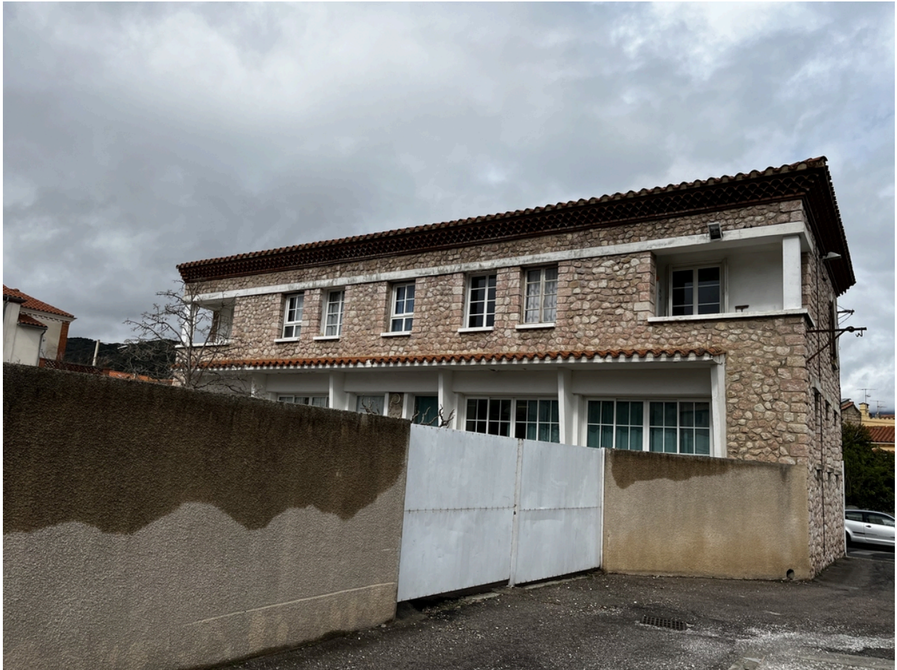
École maternelle, Écoles primaires de filles et de garçons, actuelles école maternelle Pasteur, écoles élémentaires Jean Petit et Jean Clerc - Façade Sud du bâtiment à maçonnerie en marbre rose de l'école élémentaire Jean Clerc.