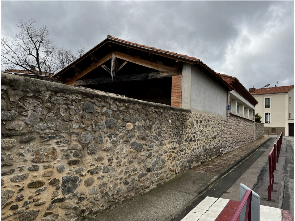
École maternelle, Écoles primaires de filles et de garçons, actuelles école maternelle Pasteur, écoles élémentaires Jean Petit et Jean Clerc - Vue Nord-Est du préau avec charpente apparente de l'école maternelle.