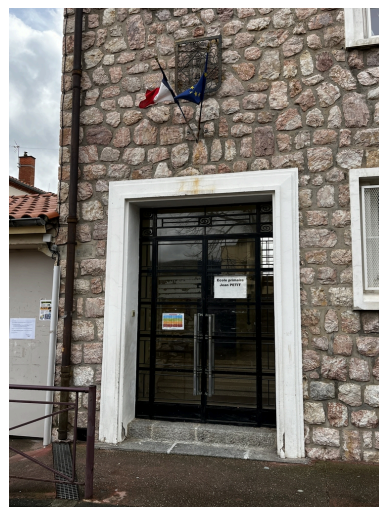
École maternelle, Écoles primaires de filles et de garçons, actuelles école maternelle Pasteur, écoles élémentaires Jean Petit et Jean Clerc - Entrée avec portail en fonte du bâtiment à maçonnerie en marbre rose de l'actuelle école élémentaire Jean Petit. IVR76_20226665775NUCA