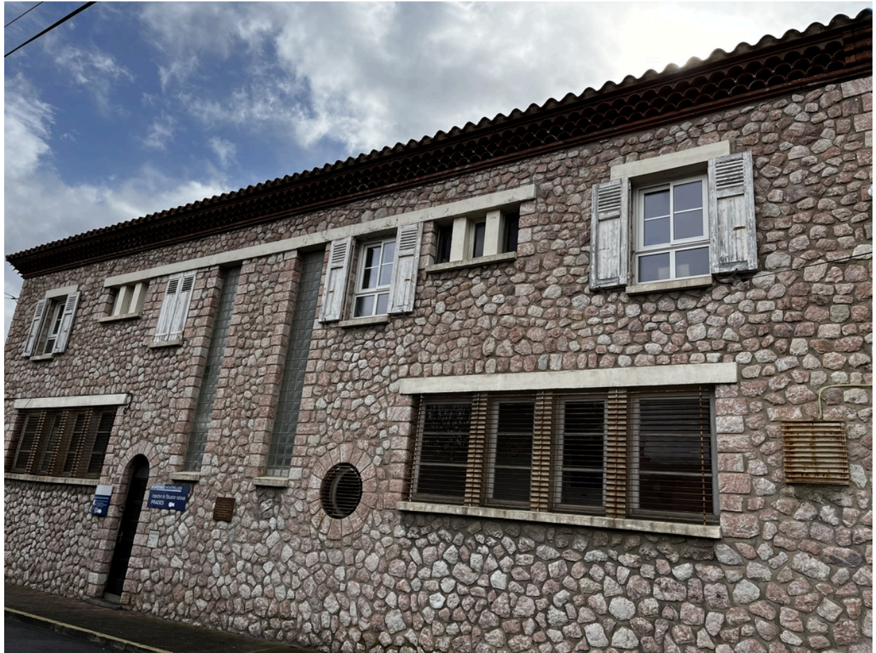
École maternelle, Écoles primaires de filles et de garçons, actuelles école maternelle Pasteur, écoles élémentaires Jean Petit et Jean Clerc - Façade Nord du corps de bâtiment à maçonnerie en marbre rose de l'école élémentaire Jean Clerc.