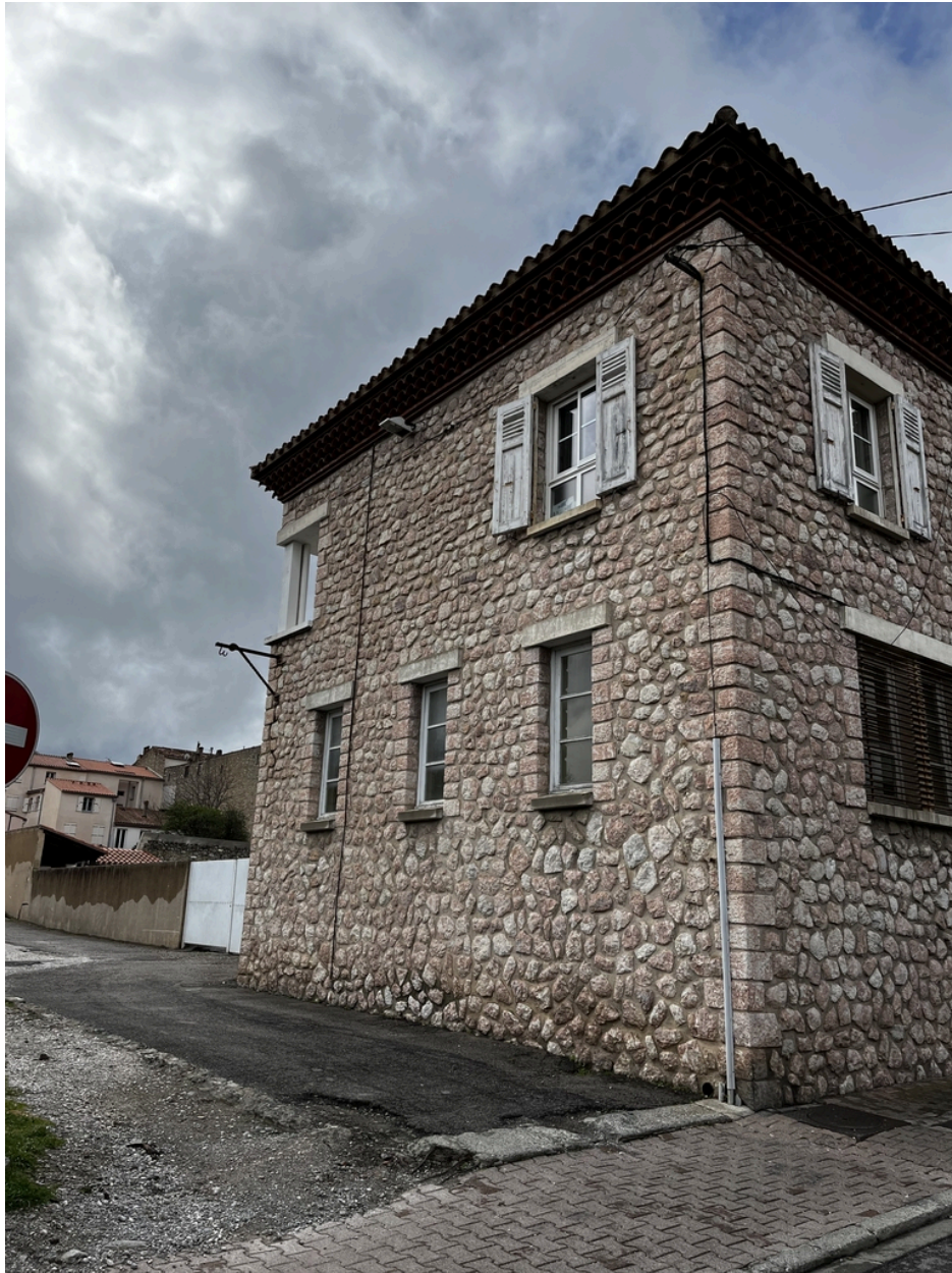
École maternelle, Écoles primaires de filles et de garçons, actuelles école maternelle Pasteur, écoles élémentaires Jean Petit et Jean Clerc - Angle Nord-Est du bâtiment à maçonnerie en marbre rose de l'école élémentaire Jean Clerc.