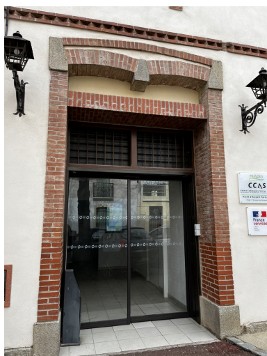
École supérieure des filles, puis Collège Moderne de Garçons dit « Pasteur » - Porte au rez-de-chaussée de l'avant-corps latéral Ouest.

IVR76_20226665796NUCA