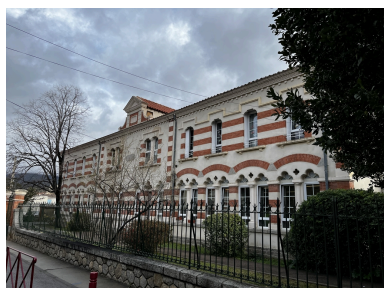
École maternelle, Écoles primaires de filles et de garçons, actuelles école maternelle Pasteur, écoles élémentaires Jean Petit et Jean Clerc - Façade principale de l'école primaire de garçons.