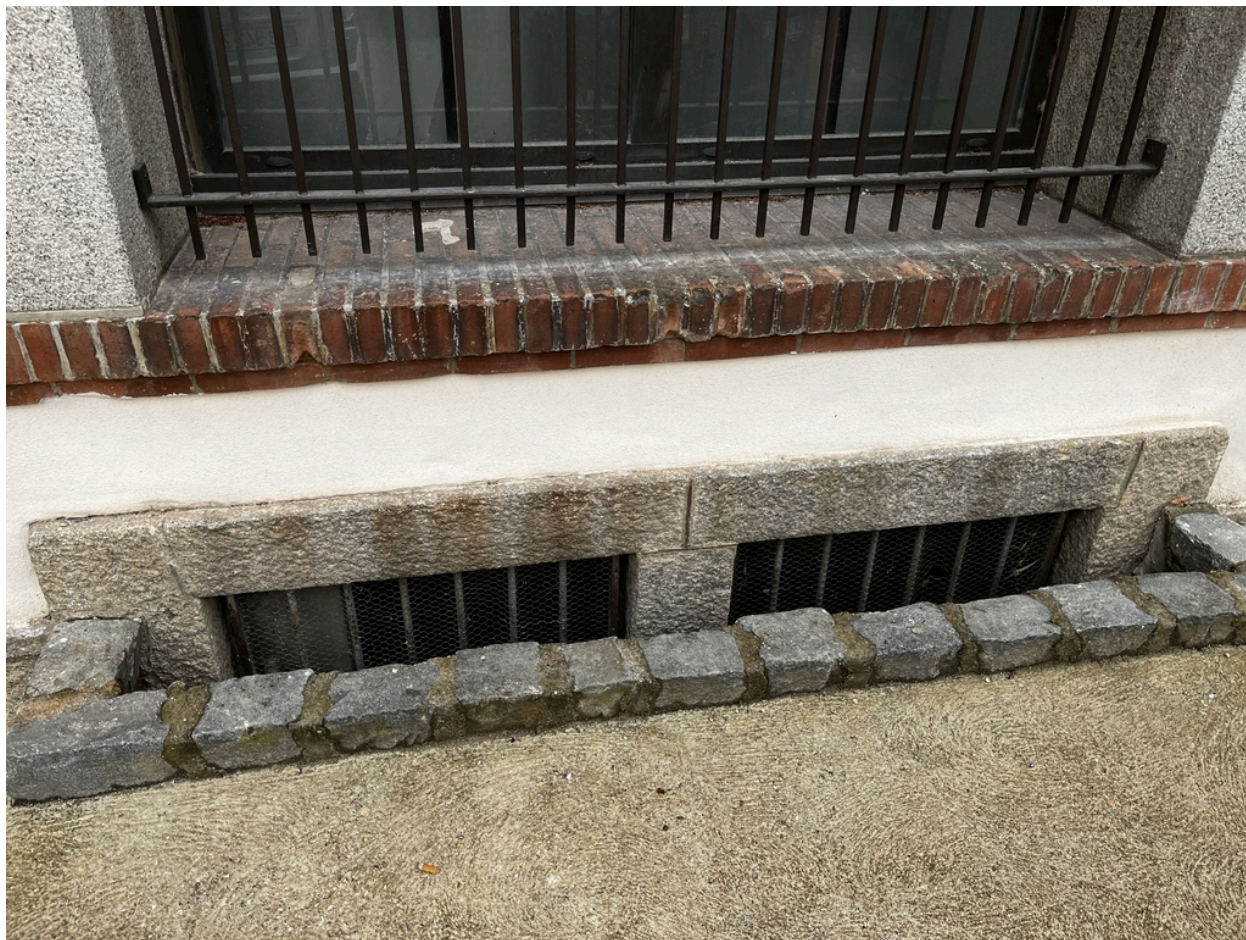
École supérieure des filles, puis Collège Moderne de Garçons dit « Pasteur » - Détail d'un soupirail en façade Nord du bâtiment principal.