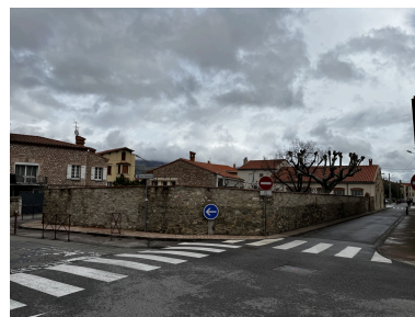
École maternelle, Écoles primaires de filles et de garçons, actuelles école maternelle Pasteur, écoles élémentaires Jean Petit et Jean Clerc - Vue Sud-Ouest de la maternelle. IVR76_20226665784NUCA