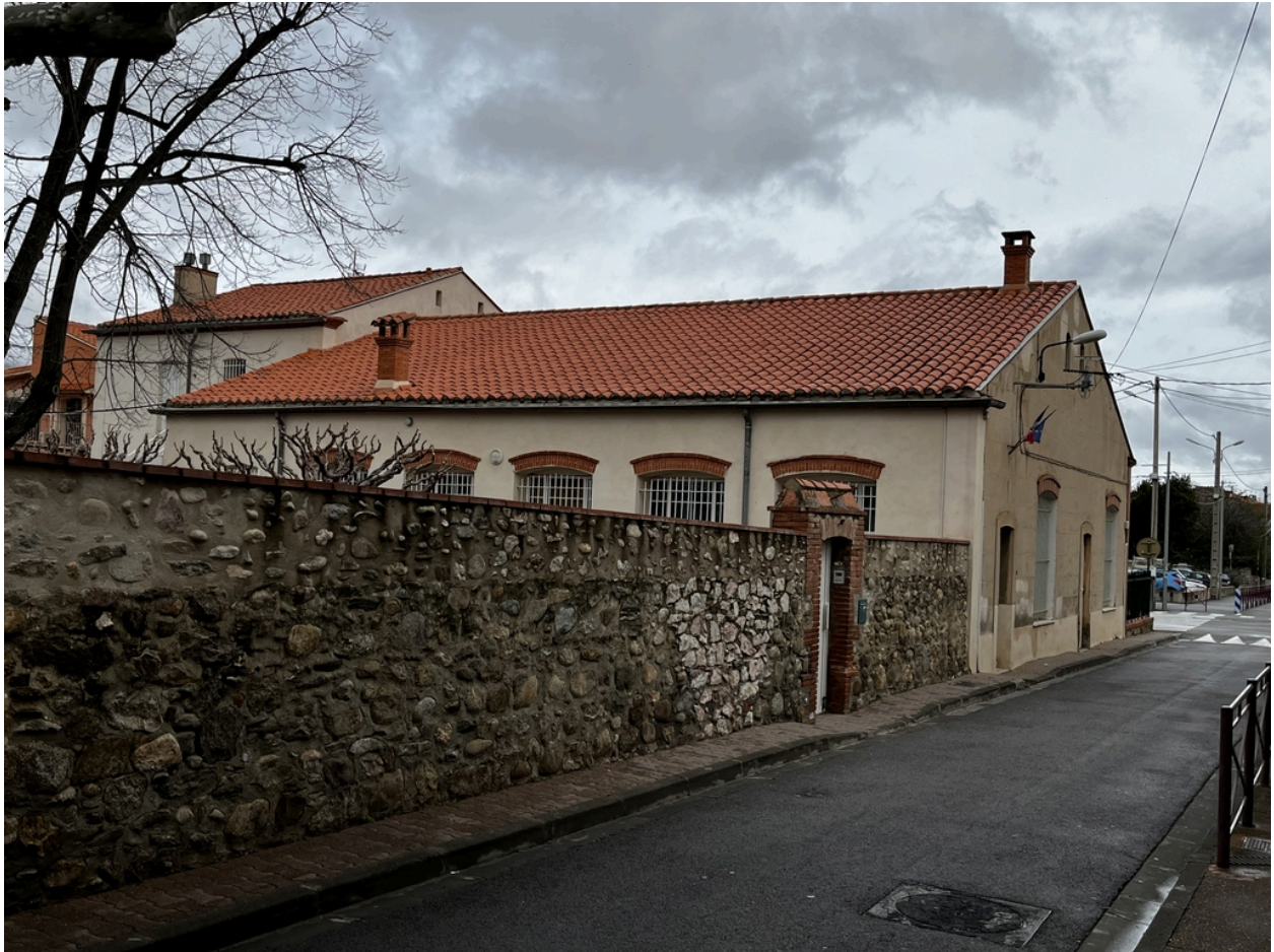
École maternelle, Écoles primaires de filles et de garçons, actuelles école maternelle Pasteur, écoles élémentaires Jean Petit et Jean Clerc - Vue Sud-Ouest du bâtiment principal de la maternelle.