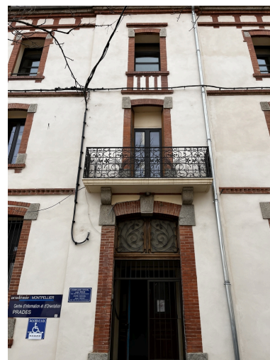
École supérieure des filles, puis Collège Moderne de Garçons dit « Pasteur » - Travée axiale en façade Nord du bâtiment principal.