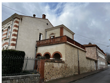
École maternelle, Écoles primaires de filles et de garçons, actuelles école maternelle Pasteur, écoles élémentaires Jean Petit et Jean Clerc - Pavillon Nord de l'école primaire de filles. IVR76_20226665773NUCA

et Jean Clerc - Pavillon Sud de l'école primaire de filles. IVR76_20226665772NUCA