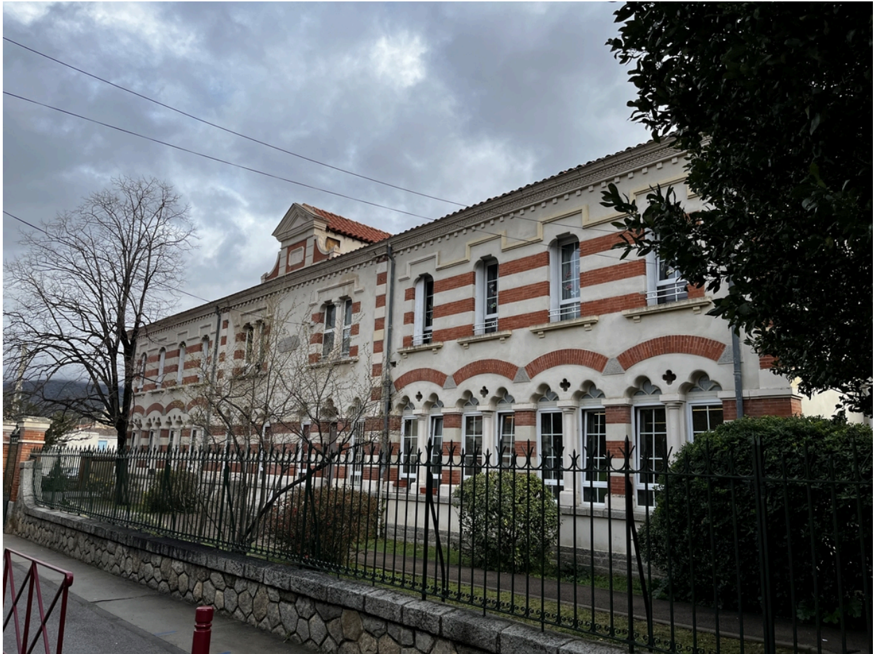
École maternelle, Écoles primaires de filles et de garçons, actuelles école maternelle Pasteur, écoles élémentaires Jean Petit et Jean Clerc - Façade principale de l'école primaire de garçons.