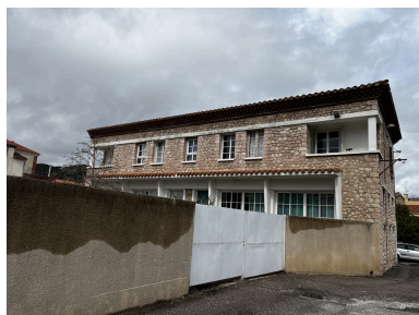
École maternelle, Écoles primaires de filles et de garçons, actuelles école maternelle Pasteur, écoles élémentaires Jean Petit et Jean Clerc - Façade Sud du bâtiment à maçonnerie en marbre rose de l'école élémentaire Jean Clerc.