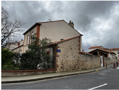
École maternelle, Écoles primaires de filles et de garçons, actuelles école maternelle Pasteur, écoles élémentaires Jean Petit et Jean Clerc - Vue Nord du bâtiment principal de la maternelle.