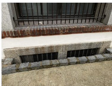
École supérieure des filles, puis Collège Moderne de Garçons dit « Pasteur » - Détail d'un soupirail en façade Nord du bâtiment principal.

IVR76_20226665796NUCA