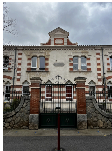
École maternelle, Écoles primaires de filles et de garçons, actuelles école maternelle Pasteur, écoles élémentaires Jean Petit et Jean Clerc - Façade principale avec portail d'entrée de l'école primaire de garçons.