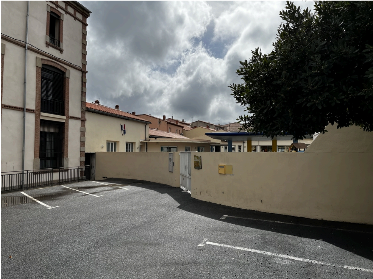
École supérieure des filles, puis Collège Moderne de Garçons dit « Pasteur » - École maternelle Arago.