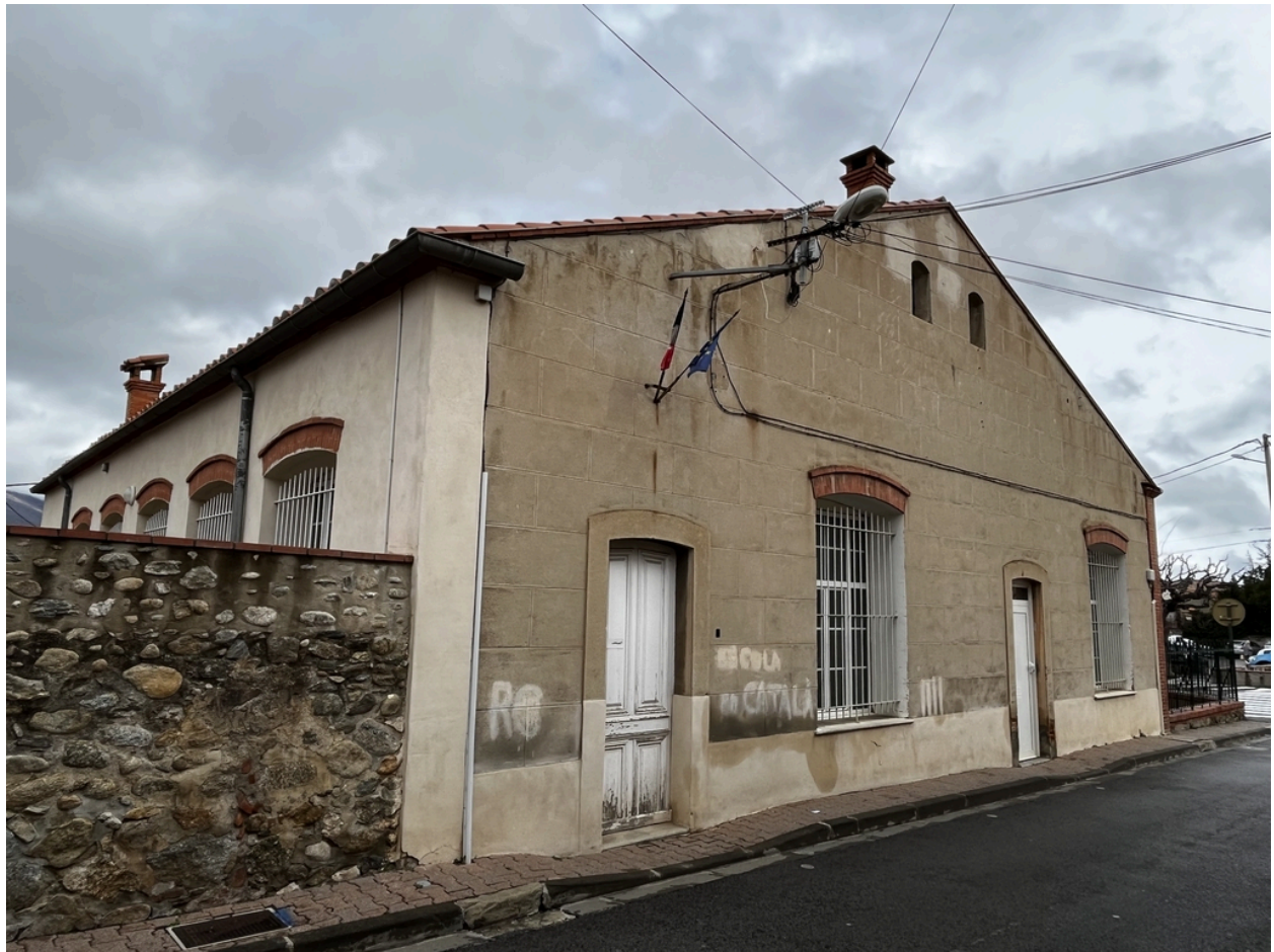
École maternelle, Écoles primaires de filles et de garçons, actuelles école maternelle Pasteur, écoles élémentaires Jean Petit et Jean Clerc - Façade Sud du bâtiment principal de la maternelle.