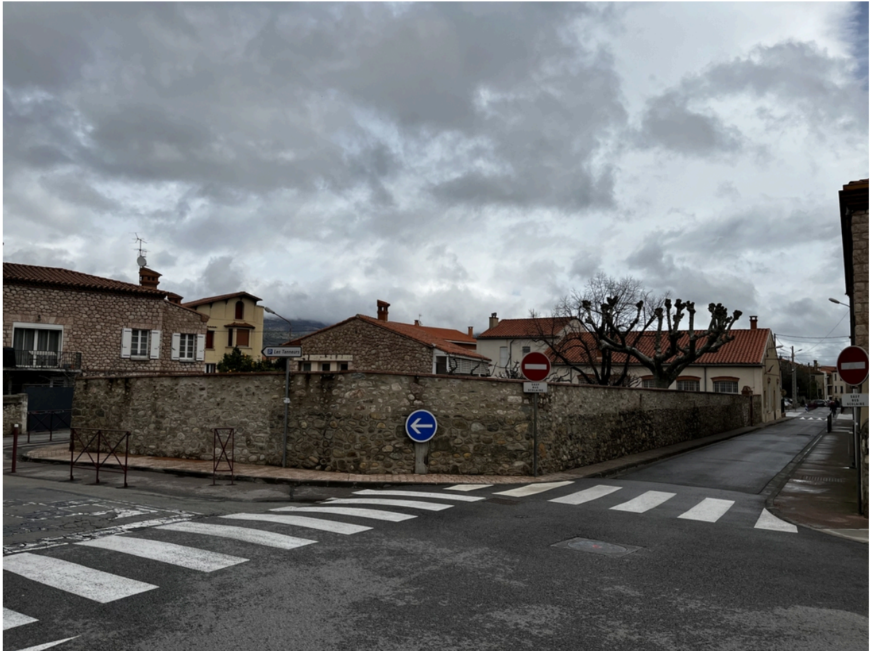
École maternelle, Écoles primaires de filles et de garçons, actuelles école maternelle Pasteur, écoles élémentaires Jean Petit et Jean Clerc - Vue Sud-Ouest de la maternelle.