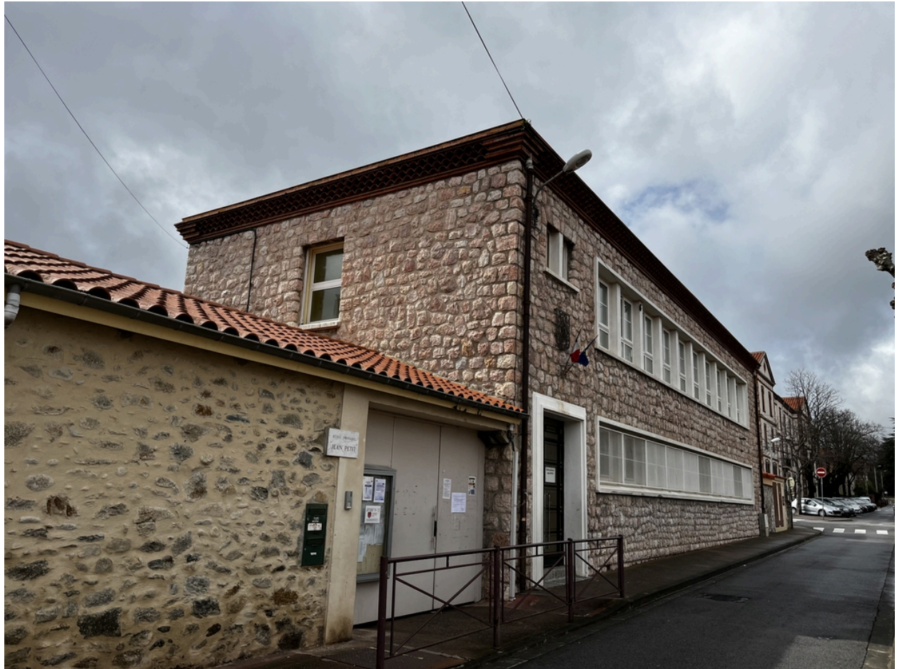
École maternelle, Écoles primaires de filles et de garçons, actuelles école maternelle Pasteur, écoles élémentaires Jean Petit et Jean Clerc - Corps de bâtiment à maçonnerie en marbre rose de l'actuelle école élémentaire Jean Petit.