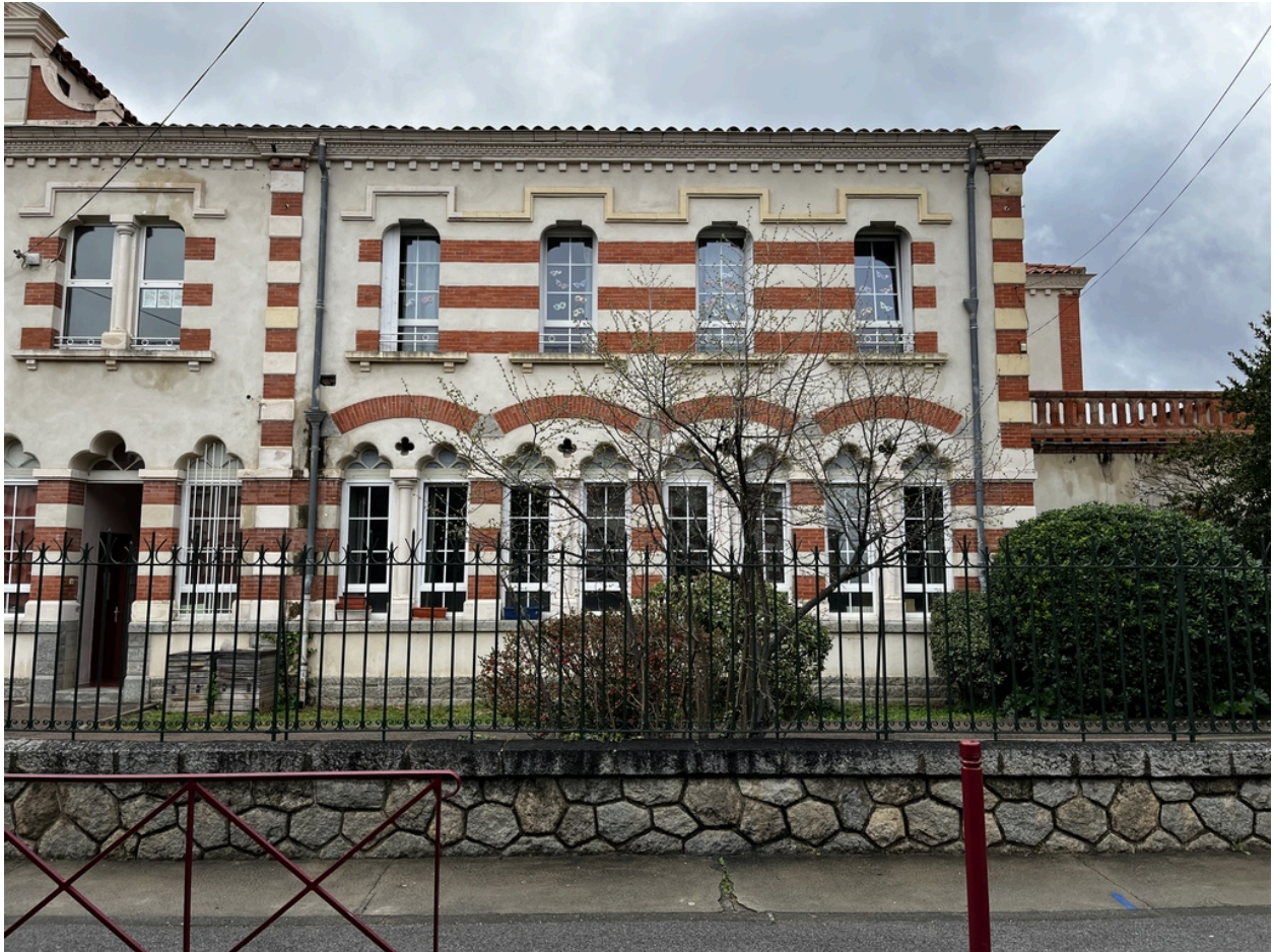
École maternelle, Écoles primaires de filles et de garçons, actuelles école maternelle Pasteur, écoles élémentaires Jean Petit et Jean Clerc - Façade principale (partie Sud) de l'école primaire de garçons.