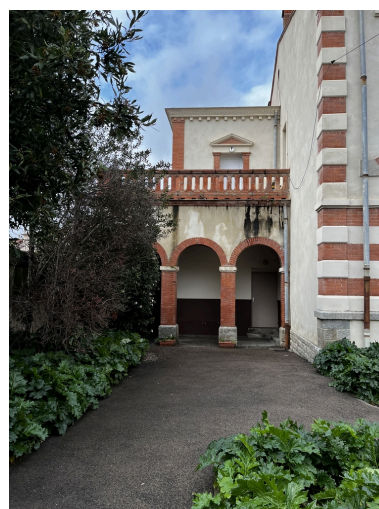
École maternelle, Écoles primaires de filles et de garçons, actuelles école maternelle Pasteur, écoles élémentaires Jean Petit