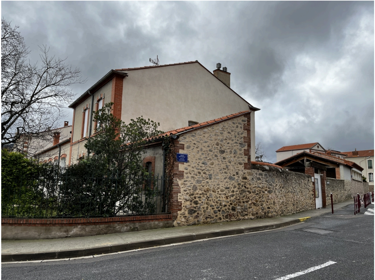
École maternelle, Écoles primaires de filles et de garçons, actuelles école maternelle Pasteur, écoles élémentaires Jean Petit et Jean Clerc - Vue Nord du bâtiment principal de la maternelle.