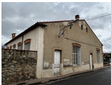
École maternelle, Écoles primaires de filles et de garçons, actuelles école maternelle Pasteur, écoles élémentaires Jean Petit et Jean Clerc - Façade Sud du bâtiment principal de la maternelle.