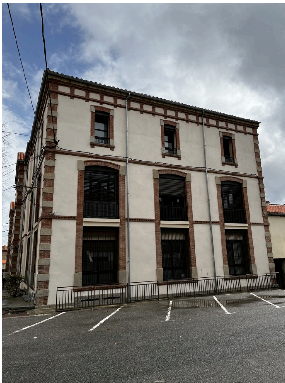
École supérieure des filles, puis Collège Moderne de Garçons dit « Pasteur » - Façade Ouest du corps de bâtiment principal.