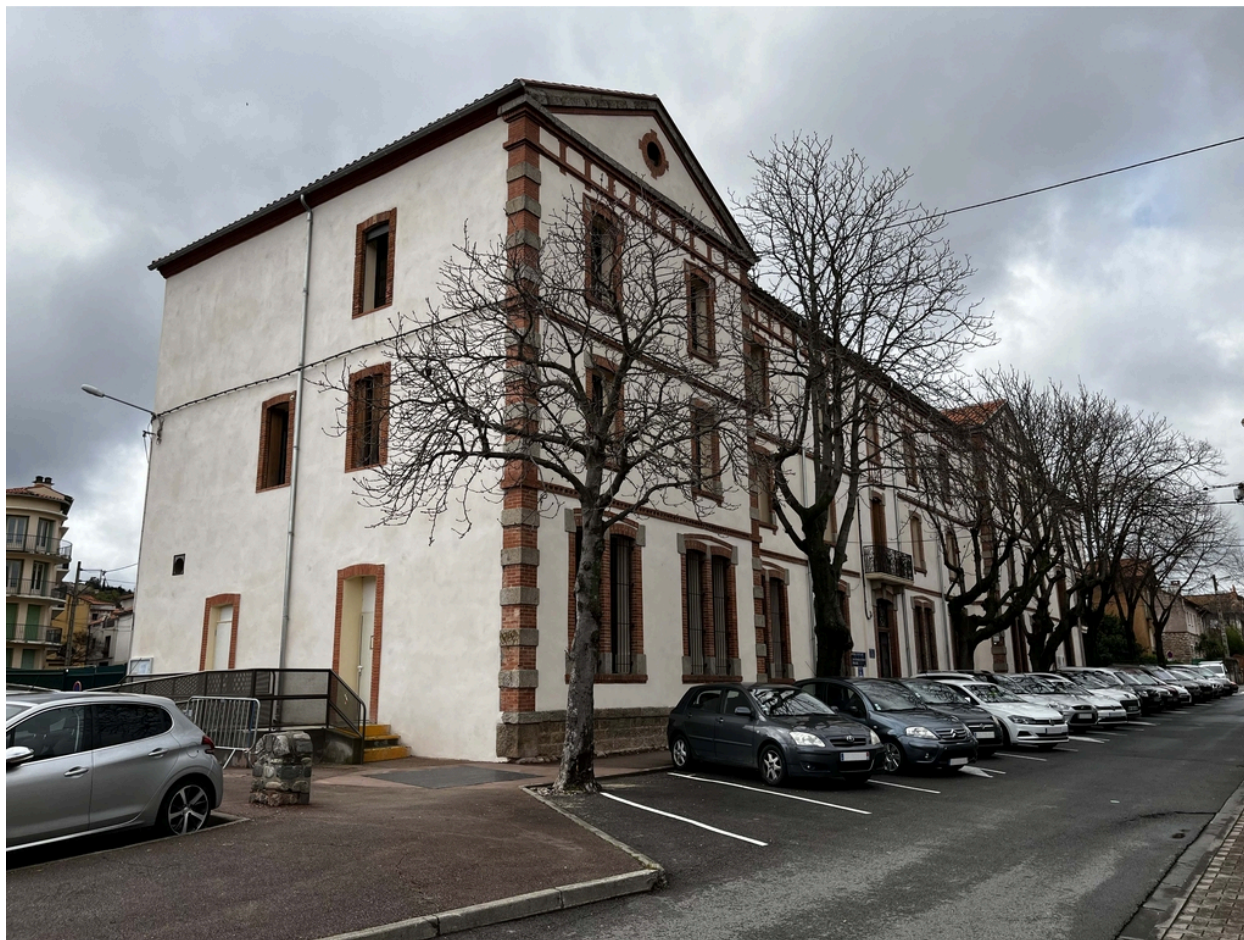
École supérieure des filles, puis Collège Moderne de Garçons dit « Pasteur » - Vue générale Nord-Est du bâtiment principal.