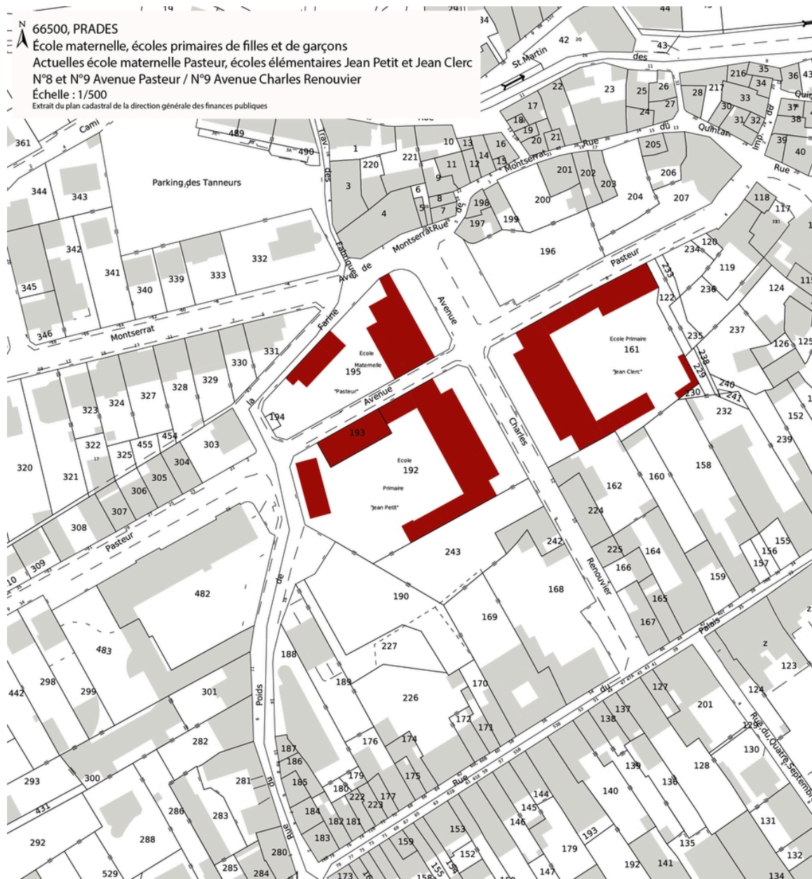
École maternelle, Écoles primaires de filles et de garçons, actuelles école maternelle Pasteur, écoles élémentaires Jean Petit et Jean Clerc - Localisation des parcelles sur le cadastre de 2022.