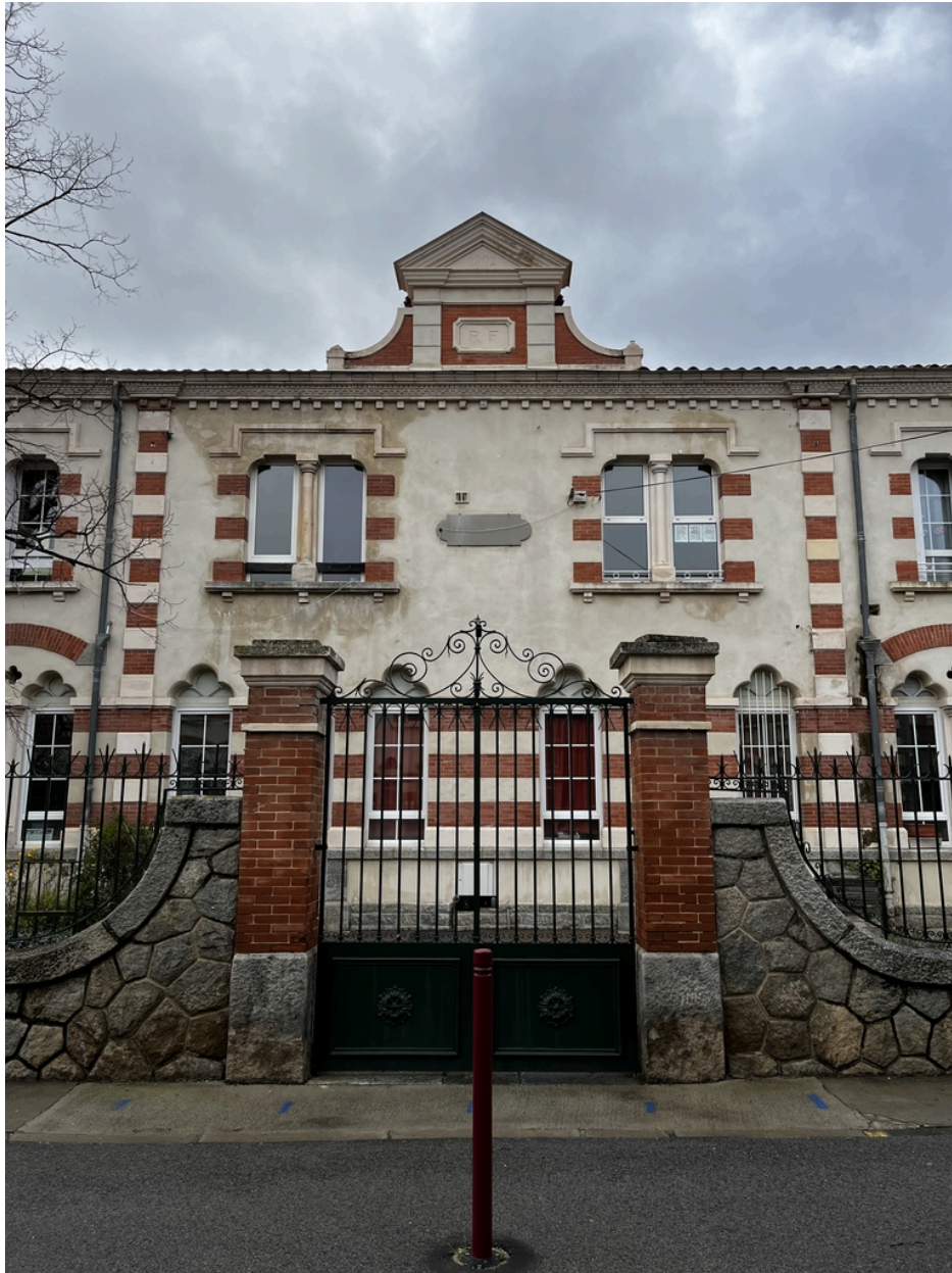
École maternelle, Écoles primaires de filles et de garçons, actuelles école maternelle Pasteur, écoles élémentaires Jean Petit et Jean Clerc - Façade principale avec portail d'entrée de l'école primaire de garçons.