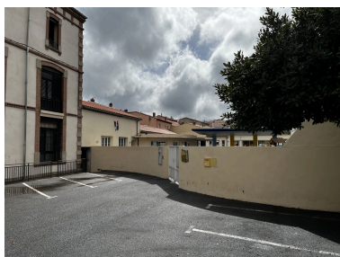
École supérieure des filles, puis Collège Moderne de Garçons dit « Pasteur » - École maternelle Arago. IVR76_20226665794NUCA