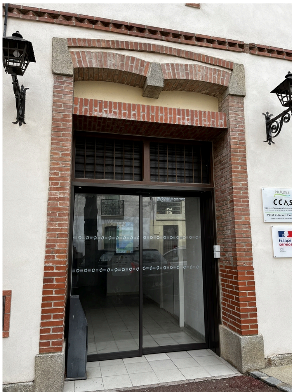
École supérieure des filles, puis Collège Moderne de Garçons dit « Pasteur » - Porte au rez-de-chaussée de l'avant-corps latéral Ouest.