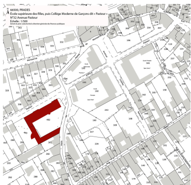
École supérieure des filles, puis Collège Moderne de Garçons dit « Pasteur » - Localisation des parcelles sur le cadastre de 2022.