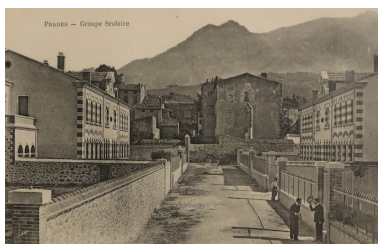
École maternelle, Écoles primaires de filles et de garçons, actuelles école maternelle Pasteur, écoles élémentaires Jean Petit et Jean Clerc - Groupe scolaire - Carte postale. Sans date. IVR76_20226665768NUCA