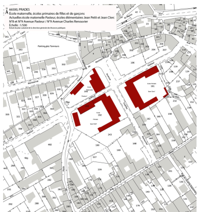
École maternelle, Écoles primaires de filles et de garçons, actuelles école maternelle Pasteur, écoles élémentaires Jean Petit et Jean Clerc - Localisation des parcelles sur le cadastre de 2022.