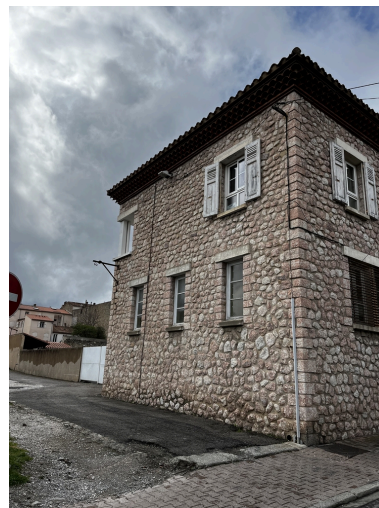
École maternelle, Écoles primaires de filles et de garçons, actuelles école maternelle Pasteur, écoles élémentaires Jean Petit et Jean Clerc - Angle Nord-Est du bâtiment à maçonnerie en marbre rose de l'école élémentaire Jean Clerc.