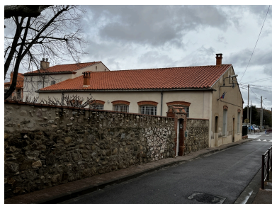
École maternelle, Écoles primaires de filles et de garçons, actuelles école maternelle Pasteur, écoles élémentaires Jean Petit et Jean Clerc - Vue Sud-Ouest du bâtiment principal de la maternelle.