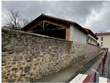
École maternelle, Écoles primaires de filles et de garçons, actuelles école maternelle Pasteur, écoles élémentaires Jean Petit et Jean Clerc - Vue Nord-Est du préau avec charpente apparente de l'école maternelle.