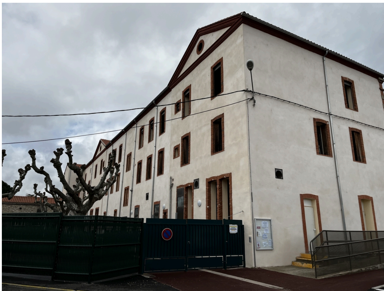
École supérieure des filles, puis Collège Moderne de Garçons dit « Pasteur » - Vue générale Sud-Est du bâtiment principal.