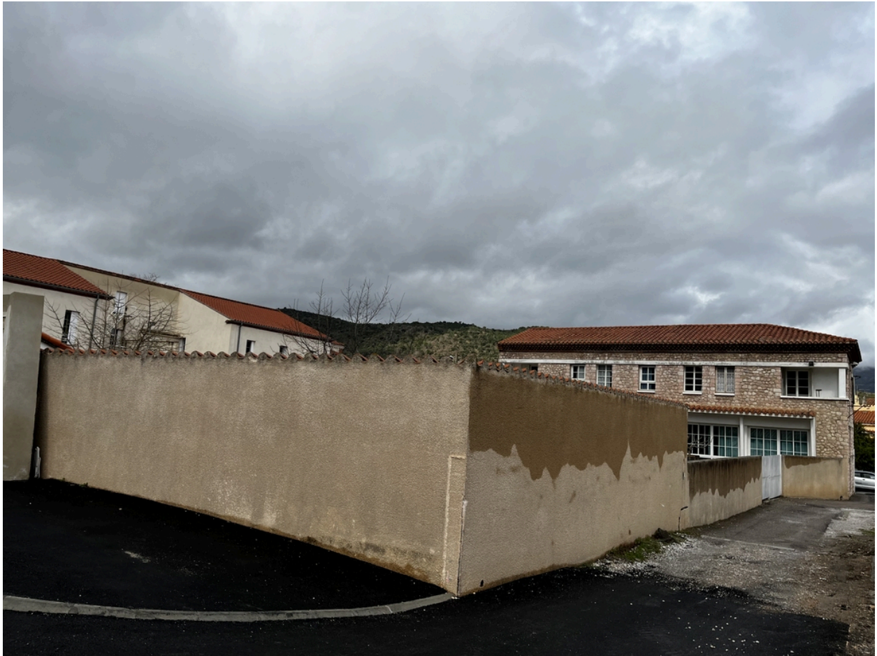
École maternelle, Écoles primaires de filles et de garçons, actuelles école maternelle Pasteur, écoles élémentaires Jean Petit et Jean Clerc - Vue Sud-Est de la cour intérieure et du bâtiment à maçonnerie en marbre rose de l'école élémentaire Jean Clerc.