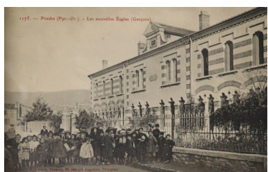
École maternelle, Écoles primaires de filles et de garçons, actuelles école maternelle Pasteur, écoles élémentaires Jean Petit et Jean Clerc - Les nouvelles Ecoles (Garçons). Carte postale. Sans date. IVR76_20226665770NUCA