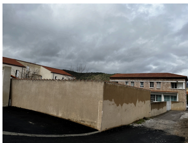
École maternelle, Écoles primaires de filles et de garçons, actuelles école maternelle Pasteur, écoles élémentaires Jean Petit et Jean Clerc - Vue Sud-Est de la cour intérieure et du bâtiment à maçonnerie en marbre rose de l'école élémentaire Jean Clerc.