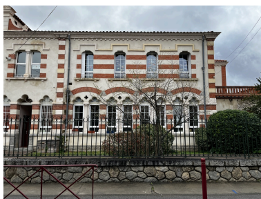
École maternelle, Écoles primaires de filles et de garçons, actuelles école maternelle Pasteur, écoles élémentaires Jean Petit et Jean Clerc - Façade principale (partie Sud) de l'école primaire de garçons.